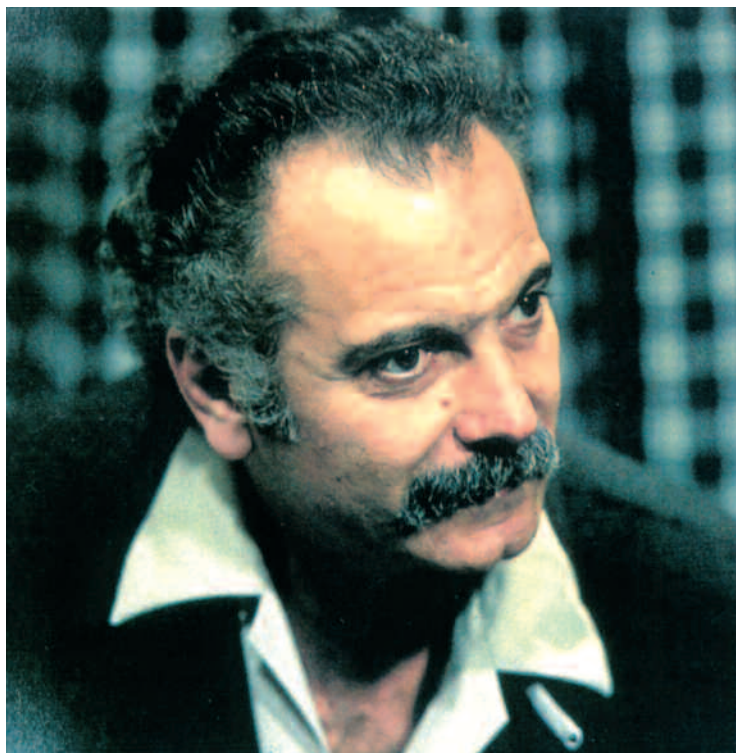
Georges Brassens.