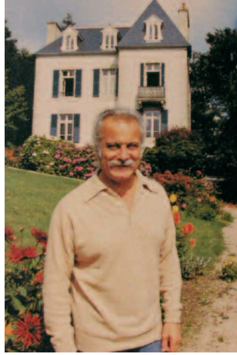
Georges Brassens.