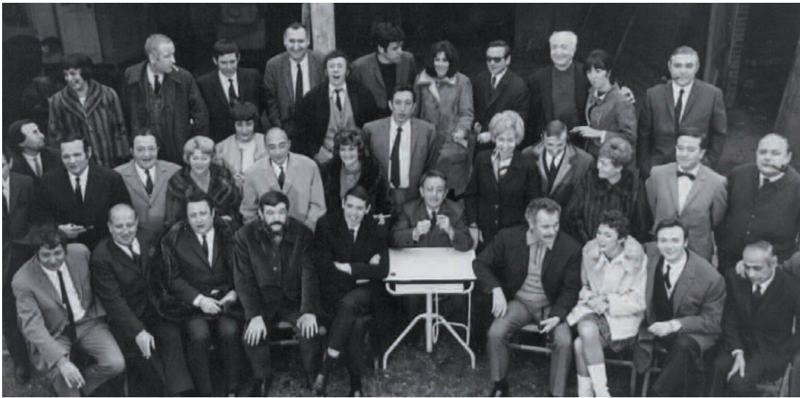
Extrait de la vidéo du coffret "film de famille" - 1967. Pour les 20 ans du Théâtre des Trois Baudets, Jacques Canetti réunit quelques artistes. La photo devient mouvement. Ils choisissent leurs places pour cette photo de famille.