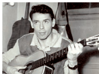
1957 - Jacques Brel dans les coulisses des 3 Baudets.