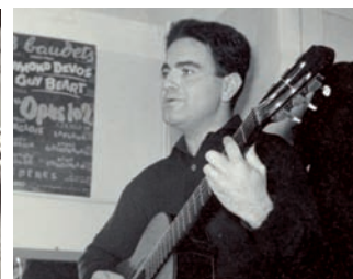
1957 - Guy Béart dans sa loge aux Trois Baudets