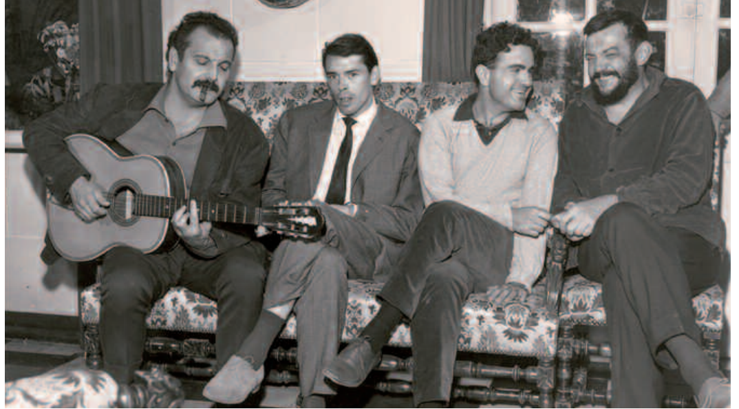
Extrait de la vidéo du coffret “Rendez-vous chez Jacques Canetti à St-Cyr-sur-Morin” avec Georges Brassens, Jacques Brel, Guy Béart et Jean-Pierre Chabrol

Jacques Brel 1960 extrait du film inédit